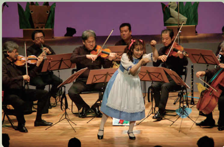
2011年七ヶ浜国際村ホール公演

みんなの参加でお芝居が進む「体験型」物語付きクラシックコンサート! 「不思議の国のアリス」のアリスや森の動物たちが、歌や演奏曲をお芝居で紹介し ます。オペラ歌手の歌声と10名のオーケストラの生演奏をお楽しみください!