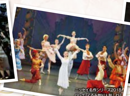
ニッセイ名作シリーズ2018 バレエ「くるみ割り人形」より