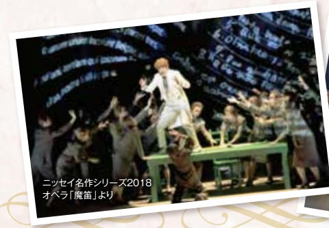
ニッセイ名作シリーズ2018 オペラ「魔笛」より